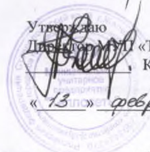
График останова котельных МУП «Теплосеть» для проведения плановых ремонтных работ при подготовке объектов к работе в осенне-зимний период 2017-2018 годы.