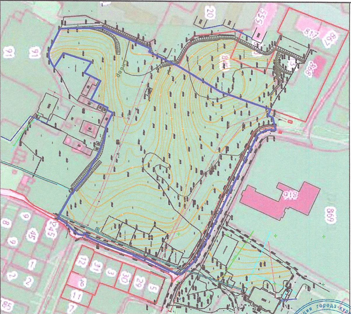
Схема расположения подлежащей комплексному развитию незастроенной территории квартала в районе улиц Кутузова, Развальной в городе-курорте Железноводске Ставропольского края