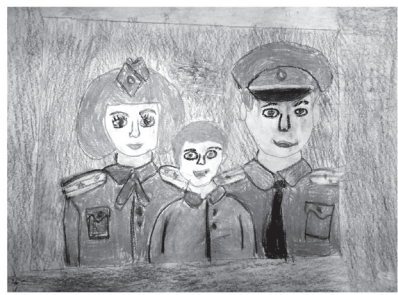
По материалам пресс-службы Отдела МВД России по городу Железноводску

Лучшие работы представят Железноводск на краевом этапе конкурса.