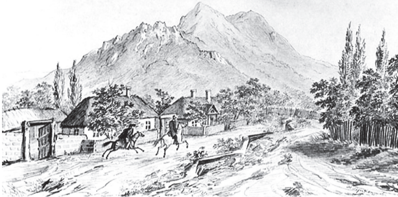
Дорога в Немецкую колонию

Цель своего многолетнего исследования автор объяснила так: «Воспитание памятью – самое достойное и эффективное воспитание нравственности. Без него нет любви к отчому краю, нет гордости за родной уголок». С этим трудно не согласиться.