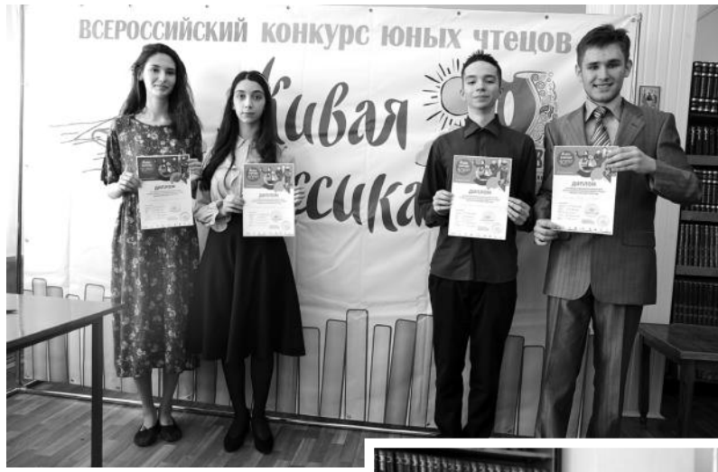
ном этапе конкурса «Живая классика-2021», который пройдет в Ставрополе.

Теперь этим ребятам предстоит поучаствовать в региональ-