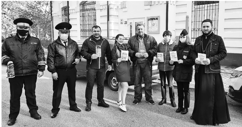
Уважаемые участники дорожного движения!

Организаторы акции обошли все улицы микрорайона и провели профилактические беседы с гражданами по соблюдению безопасного поведения на дороге, вручили памятки законопослушного участника дорожного движения и оставили на ручках автомобильных дверей и частных домовладений дорхенгеры.