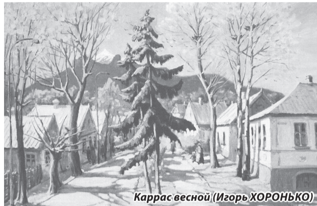
Каррас весной (Игорь ХОРОНЬКО)

Далее сообщалось, что для наведения порядка управляющий ВЖД был вынужден обратиться за помощью к жандармской полиции, виновники в срыве графика движения поездов были привлечены к уголовной ответственности.