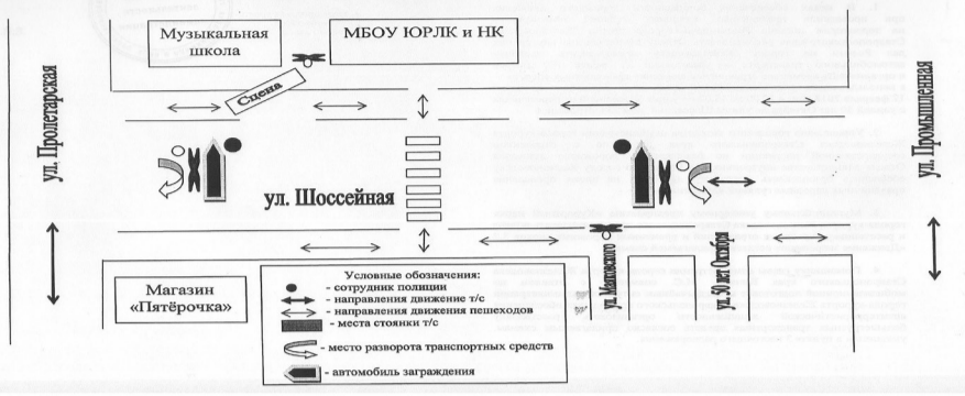
СХЕМА расстановки сотрудников полиции, временных ТСОДЛ, стоянок автотранспорта на время проведения праздничных мероприятий в поселке Иноземье города-курорта Железноводска Ставропольского края с 10.00 до 15.00 ч. 17 февраля 2018 года

«УТВЕРЖДАЮ» Заместитель главы администрации города-курорта Железноводска Ставропольского края Н.Н. Бондаренко