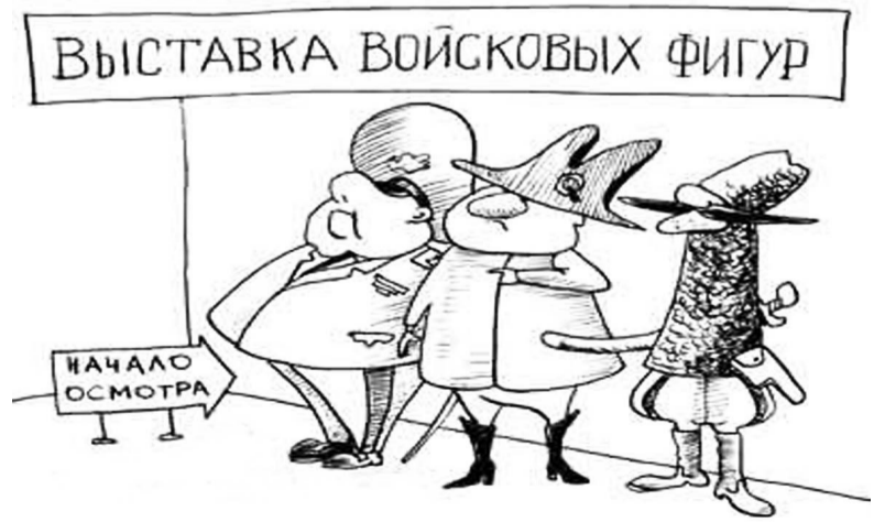
Полоса подготовлена по материалам информагентств

Многие пираты, даже очень бедные, носили в ушах драгоценные серьги, которые в случае смерти хозяина могли послужить своеобразной оплатой за нормальные похороны.