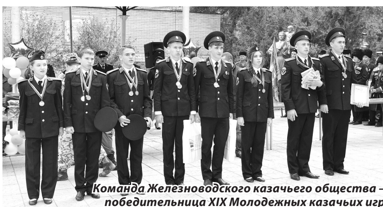
Команда Железноводского казачьего общества – победительница XIX Молодежных казачьих игр

О том, как проходили XX краевые Молодежные казачьи игры, читайте в следующем номере городской газеты.