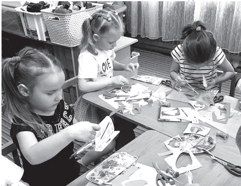
По материалам пресс-службы администрации Железноводска

Дошкольное образовательное учреждение отметили высшей наградой всероссийского открытого смотроконкурса.