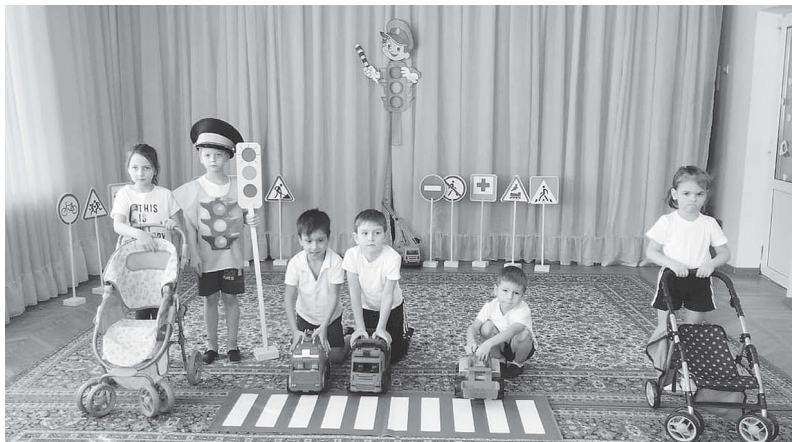
По материалам ОГИБДД ОМВД России по городу Железноводску

Для формирования у детей навыков безопасного поведения на улицах и дорогах, развития и умения ориентироваться в дорожной обстановке, воспитания грамотных пешеходов Госавтоинспекция Железноводска встретилась с воспитанниками старшей группы «Непоседы» и подготовительной группы «Светлячки».