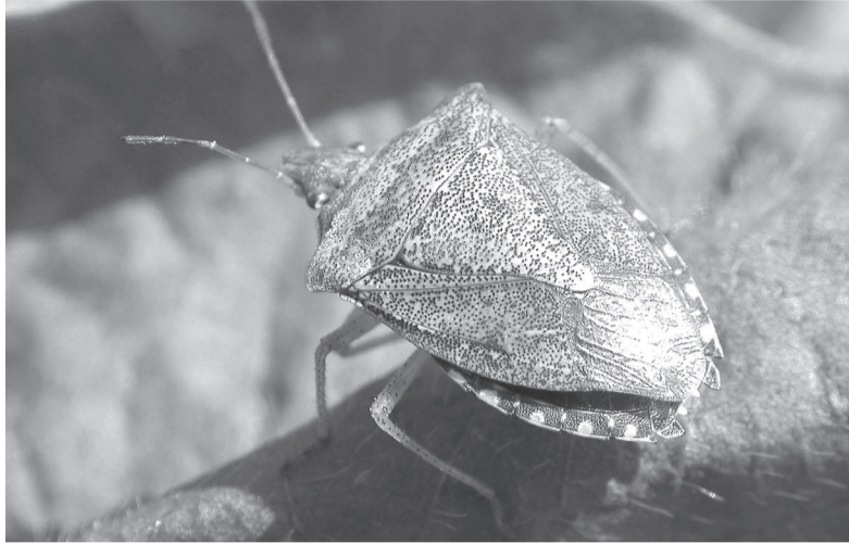
Коричнево-мраморный клоп (Halyomorpha halys Stal.) относится к семейству клопов-щитников отряда Полужесткокрылые. С 1 июля 2017 года внесен в единый перечень карантинных объектов Евразийского экономического союза.

Коричнево-мраморный клоп – теплолюбивое насекомое, которое развивается в пределах температур от 15° С до 33° С. Оптимальная температура для развития коричнево-мраморного клопа: от 20° С до 25° С. Полное развитие от яйца до имаго при температуре 20° С проходит 80,5-85,5 дней, а при температуре 30° С – за 34-35 дней.